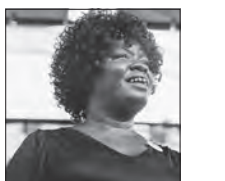
(14) Koko Taylor, Chicago Fest, August 1981, Navy Pier, Chicago, Illinois