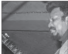
(37) Otis Rush, März 1980, Sinkkasten, Frankfurt am Main