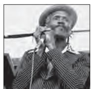
(15) Big Walter Horton, Chicago Fest, August 1981, Navy Pier, Chicago, Illinois