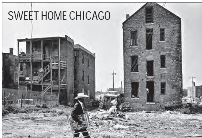
CALENDAR 2016 | VINTAGE PHOTOGRAPHS BY MARTIN FELDMANN | LAYOUT: BERND ALEXANDER