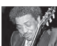
(31) Lowell Fulson, Blues Estafette, November 1980, Utrecht, Holland