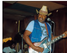
(21) Magic Slim (Morris Holt), August 1981, Florence's, South Side, Chicago, Illinois