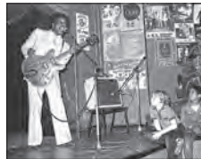
(38) Buddy Guy, Mai 1981, Sinkkasten, Frankfurt am Main