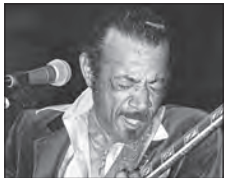
(30) Pee Wee Crayton, Blues Estafette, November 1980, Utrecht, Holland