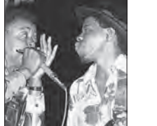
(34) Carey & Lurrie Bell, American Folk Blues Festival, März 1981, Konzerthalle, Kamen