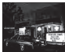
(04) Tabby's Blues Box, Außenaufnahme, nachts, August 1986, Baton Rouge, Louisiana