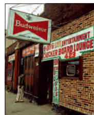
(42) Buddy Guy's old Checkerboard Lounge, 1981, Chicago.