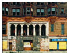
(41) Poor Ike's Blues Room im ehemaligen Lexington/ New Michigan Hotel, 1981, Chicago.