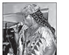
(27) Afrodyete, August 1988, Ashton's Shatto, Los Angeles, Kalifornien