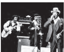
(16) Bobby Blue Bland, Chicago Fest, August 1981, Navy Pier, Chicago, Illinois