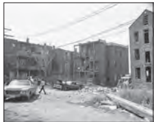
(11) Das Viertel der Maxwell Street, August 1986, Chicago, Illinois