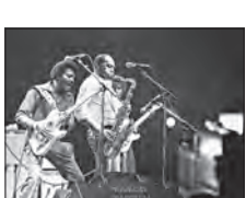
(33) Albert Collins & The Icebreakers, WDR-Rockpalast, November 1980, Westfalenhalle