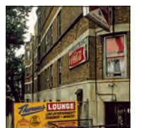
(23) Theresa's, August 1981, South Indiana Avenue, South Side, Chicago, Illinois